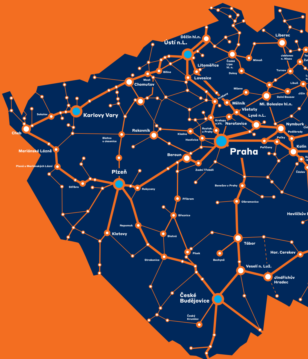
Schéma sítě tratí