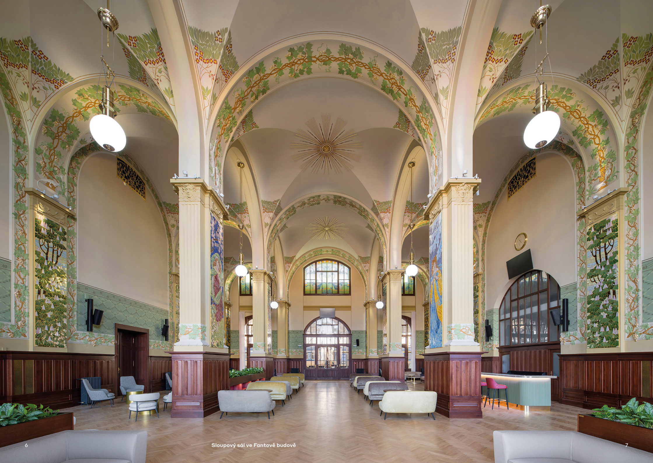
Sloupový sál ve Fantově budově